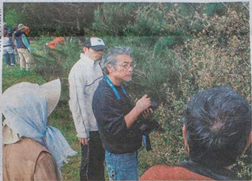
奄美大島北部を巡る自然観察会の参加者—27日、奄美市等利町の須野ダム

水出た生まれるが小説「=27日、県立奄美 秋同人。の夜の「日本文学島」(98)など。 さんは幼初めて小時代、東、県本土、夫との半生を振 伝統行事残る戸口